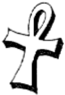
Krzyż z kokardką - Ankh (onk)

zakłęk. A.S. LaVley ukazywał ten symbol przed czarnymi mszami i orgiami w kościele satanistycznym w San Francisco. W obrzędach przyjmowania nowych członków używa się krzyża wykonanego z drzewa balsamowego lub ceramiki w celu publicznego złamania go na oznaczenie zerwania wszelkich więzów z chrześcijaństwem. Następnie zakłada się ów połamany krzyż lub krzyż Nerona na szyję na znak - pokoju z szatanem. Jest to okultystyczny symbol propagowany jako emblemat ruchów pacyfistycznych. Wśród współczesnych muzyków heavy metalowych i okultystycznych grup oznacza on upadek chrześcijaństwa (odwrócony krzyż z ramionami ku dołowi).