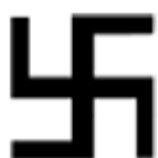
Swastyka (złamany krzyż)

M oże mieć różną wielkość - jest rysowany na ziemi, w tym miejscu, w którym podczas magicznych rytuałów ma pojawić się demon.