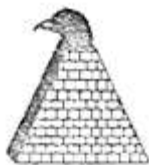
Pyramida z głową sokoła

Znak oświeconych, którzy nazywają siebie również: "Nosicielami światła" lub "Wysłannikami Lucyfera". Nawiązuje do masońskiego "boga uniwersalnego".