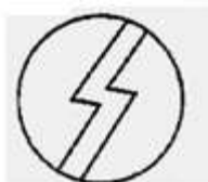
S "złamane" - błyskawica

Znak oświeconych, którzy nazywają siebie również: "Nosicielami światła" lub "Wysłannikami Lucyfera". Nawiązuje do masońskiego "boga uniwersalnego".