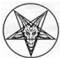
Bafomet (gwiazda głowy kozła)

W XIX wieku znany okultysta i kabalista Eliphas Levi, wprowadził podział pentagramów na "dobre i złe". Pierwszy z nich (rysunek z lewej) posiada jeden wierzchołek skierowany ku górze i jest często przedstawiany z wpisaniem w siebie wizerunkiem człowieka. Pentagram ten jest jednym z ważniejszych symboli masonerii i bywa interpretowany jako symbol człowieka (ADAM-EVE), będącego w drodze do "odrodzenia" i "ubóstwienia" - jest to więc symbol pogańskiego humanizmu inicjacyjnego. W niektórych przypadkach znak ten jest także uznawany jako symbol "dobrego" Lucyfera. Z kolei odwrócony pentagram z dwoma wierzchołkami skierowanymi ku górze (rysunek z prawej) jest uważany za symbol "złego" Szatana (SAMAEL-LILITH), przedstawionego w postaci tzw. "kozła z Mendes" (Baphometa). Przejście z jednej formy pentagramu, w drugą można uzyskać poprzez jego obrót o 33 stopnie, zaś liczba 33 ma podstawowe znaczenie w symbolice masońskiej - między innymi wiąże się ona z ilością stopni wtajemniczenia w niektórych obrządkach masońskich. Pentagram wykorzystywany był i jest w symbolice masonerii okultystycznej, magii ceremonialnej i kabalistyce oraz jako symbol komunizmu - znak gwiazdy pięcioramiennej został przedłożony bolszewikom przez Lewę Trockiego-Bronsteina, członka loży masońskiej Wielki Wschód, który zdawał sobie sprawę z jej ezoterycznego sensu. Symbol ten jest też często wykorzystywany przez zespoły rockowe, na okładkach ich płyt, w grach komputerowych, jak i w filmach.